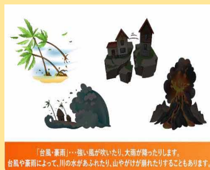
「台風・豪雨」…強い風が吹いたり、大雨が降ったりします。台風や豪雨によって、川の水があふれたり、山やがけが崩れたりすることもあります。