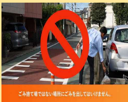
ごみ捨て場ではない場所にごみを出してはいけません。