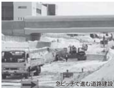
急ピッチで進む道路建設