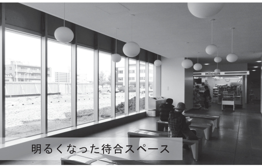
完成した野幌駅舎