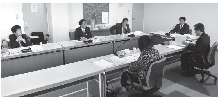
▲議会改革小委員会の様子

その他に、市長等と議会との関係、委員会の活動、議会の機能の強化、議員の政治倫理、定数及び報酬、議会改革、最高規範性、見直しなどについて定めています。