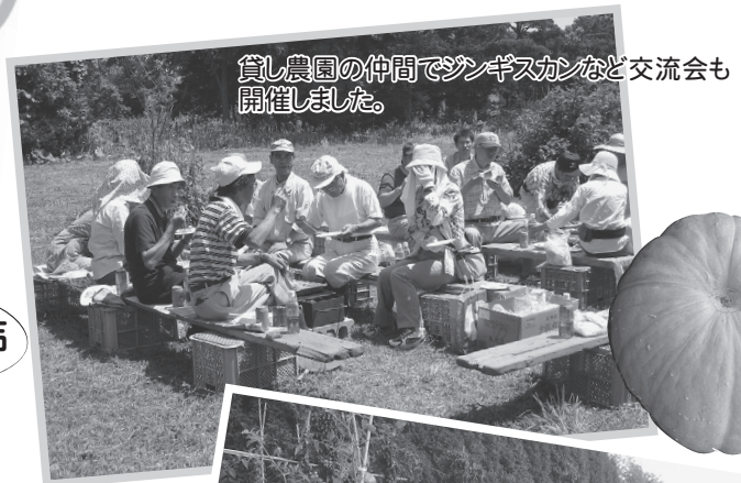
貸し農園の仲間でおんぎすかんなど交流会も開催しました。