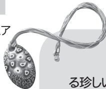
七宝教室で作られたアクセサリー。

い ちでは、5月から開講する教室の受講生を募集します。 市内在住の60歳以上の方。4月15日(月)~19日(金)の8時45分~17時15分に直接または電話で申し込みください。 各講座とも定員を超えた場合は事前に連絡し、公開抽選となります。受講料は各教室の開講式でいただきます。 申込・詳細 いきいきセンターさわかち ☎ 387・5111