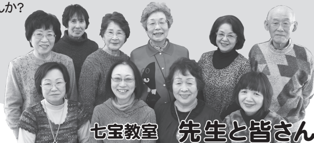
七宝教室 先生と皆さん

この教室は一から先生が直接指導してくれる珍しい教室なんです。遅れても先生が手伝ってくれるので、1年生も10年生も同じものを楽しみ作れます。可愛いアクセサリーやブローチなどを私たちと一緒に作ってみませんか？