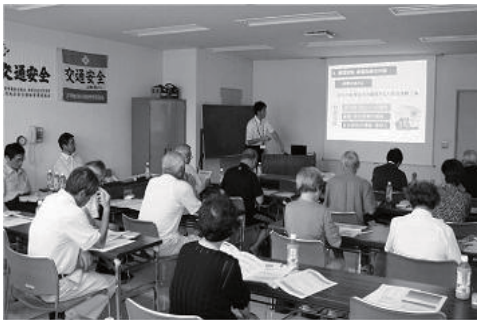
▲ 平成24年住宅の耐震化セミナー

自治会や職場など、10人以上参加予定のグループでお申し込みいただけますので、お気軽にお問い合わせください。