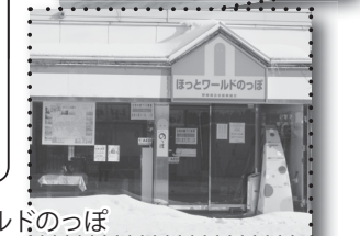
▶ ほっとワールドのっぽ