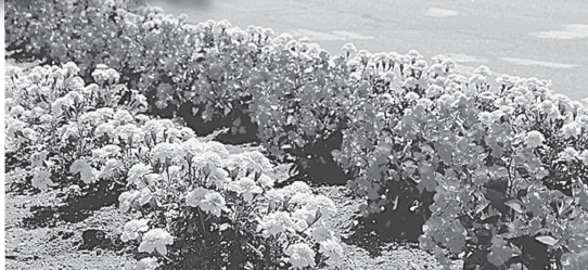
昨年の街路A部門特別賞(大麻第一住区自治連合会)

江別市民憲章推進協議会では、「花のある街並みづくり」コンテストの応募作品を募集します。 積極的に花壇づくりに取り組んでいる団体や個人などを対象に審査を行い、優秀作品を表彰し、入賞作品は、市内