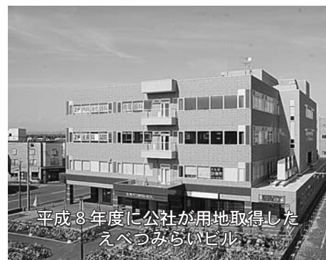
平成8年度に公社が用地取得したえべつみらいビル

にわたって市に入る税収分はさらに黒字になるものと考えられます。また、誘致した企業そのものの消費行動や、従業員が給与収入を江別市域内で消費する効果、いわゆる経済波及効果により、江別市が受ける便益はさらに大きなものになっていくと考えられます。土地開発公社の解散については、今後も広報えべつのほか、市ホームページ( http://www.city.betsu.hokkaido.jp/sounubu/info_somu/01/1.html )などでお