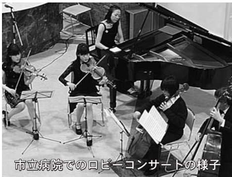
市立病院でのロビーコンサートの様子

市立病院では、外来患者さんのお手伝いや、ロビーコンサートの開催などの活動をしていただくボランティアを募集しています。