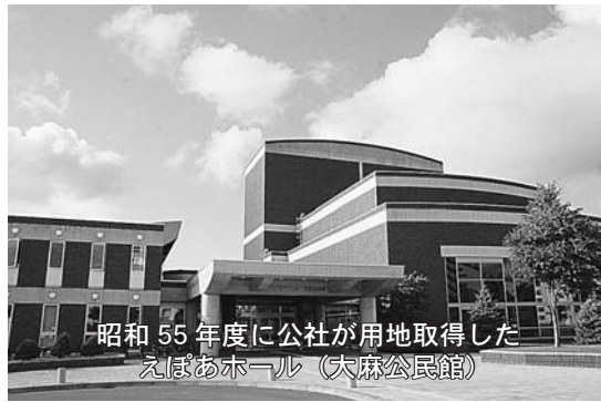
昭和55年度に公社が用地取得した えぼあホール（大麻公民館）

公社の解散には、公社の債務を整理する必要があるため、市が公社の資産である保有地などを現在の簿価で買い上げ、公社はその売却代金を借り入れた資金の返済に充てます。市では、公社の保有地などを買い上げる財源として、「第三セクター等改革推進債」を活用するほか、土地開発基金などを取り崩して資金を調達します。