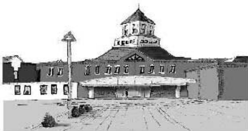
江別市セラミックアートセンター