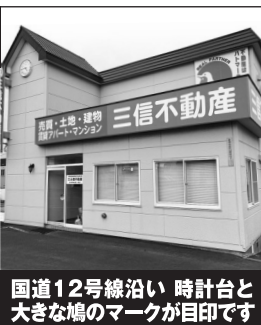
国道12号線沿い 時計台と大きな鳩のマークが目印です