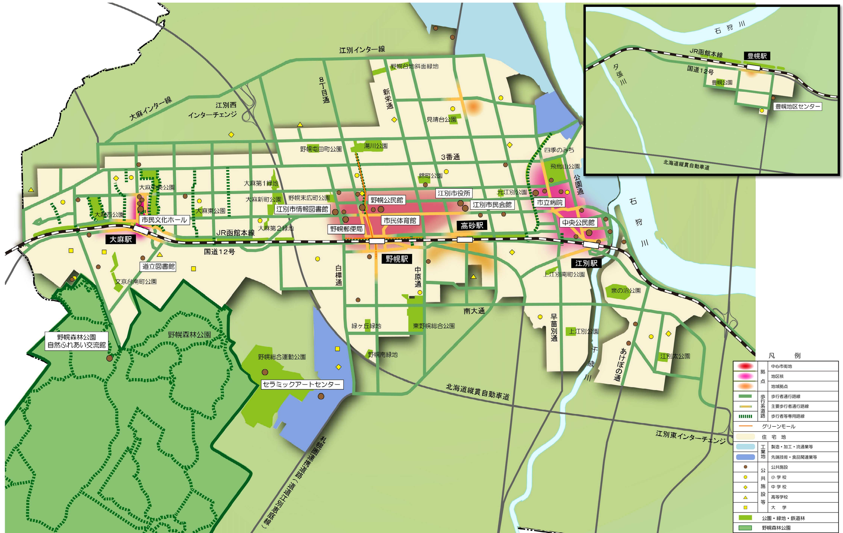
図 4-3 歩行系道路・都市計画公園緑地の方針図