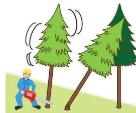
(図4)かかり木に激突させるためにかかり木以外の立木の伐倒