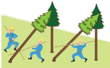
(図2)かかり木の処理

<注意> 「かかっている木の元玉切り」(かかった状態のまま元玉切りをし、地面等に落下させることにより、かかり木を外すこと。)(図5)は、今般の改正により禁止されるものではありませんが、かかり木の安全な処理方法とは言えないことに留意してください。