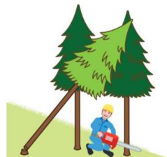
(図3)かかっている立木の伐倒