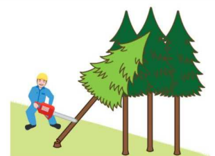
(図5)かかっている木の元玉切り