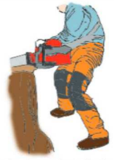
（図7）下肢の切創防止用保護衣

＜注意1＞（図7）で例示した下肢の切創防止用保護衣は、前面にソーチェーンによる損傷を防ぐ保護部材が入っており、JIS T8125-2に適合する防護ズボン又は同等以上の性能を有するものを使用してください。また、労働者の身体に合ったサイズのもを着用してください。既にソーチェーンが当たって繊維が引き出されたものなど、保護性能が低下しているものは使用しないようにしてください。