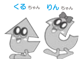
江別市リサイクルキャラクター

搬入方法や土曜、日曜・祝日などの「休日の搬入」についてのお問い合わせは、直接「環境クリーンセンター」（☎ 391-0422）へお願いします。