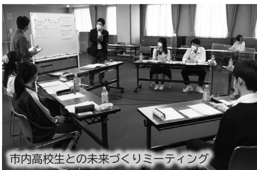
市内高校生との未来づくりミーティング

市民5千人を対象とした「まちづくり市民アンケート調査」のほか、市内の中学・高校・大学生や子育て中のパパ・ママなど、さまざまな方々と意見を交わす「えべつの未来づくりミーティング」を実施するなど、できるだけ多くの声をお聴きし、江別市行政審議会での審議を経て、素案をまとめました。