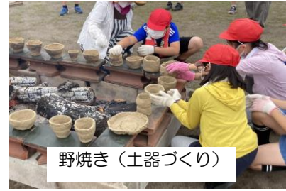
野焼き(土器づくり)