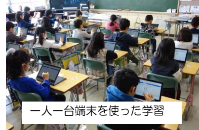
一人一台端末を使った学習