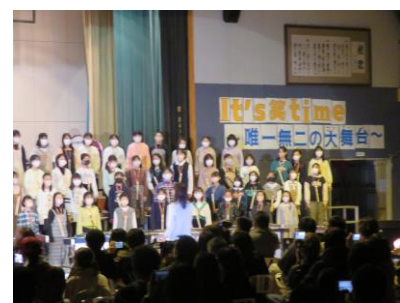
3年ぶりの学芸発表会