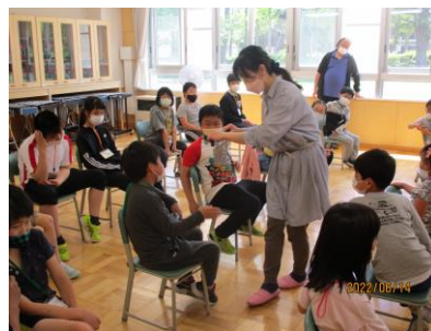
音楽広場(特別支援学級)