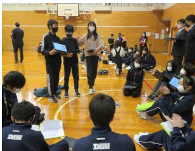
SDGs 小中合同授業 (6年)