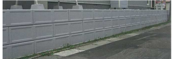
▲フェンス・擁壁工事