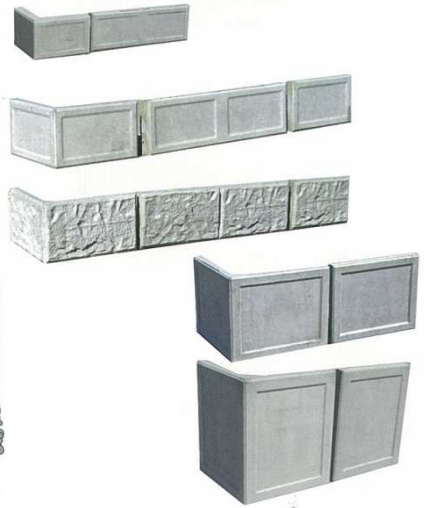
【L型土止め用ブロック】

ブロック底面の凸面突起により上下ブロックの相互のスレ止めを設け結合を容易にしている。