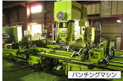
パンチングマシン