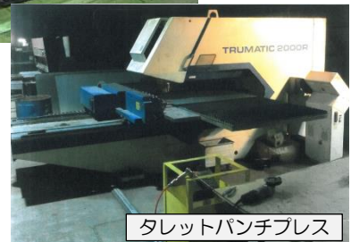
タレットパンチプレス