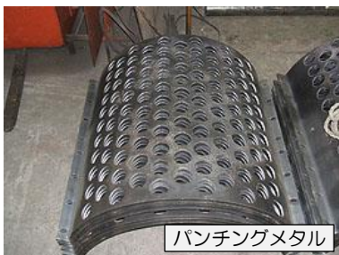
パンチングメタル