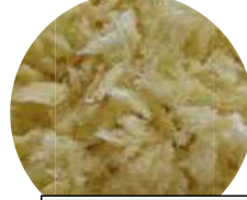
焙焼カラー生パン粉