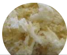
北海道産小麦使用パン粉