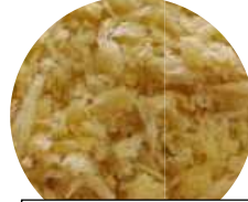
カラードライパン粉