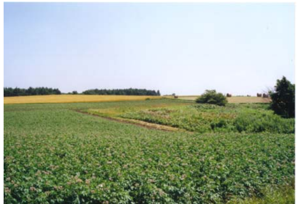
元野幌（8丁目通付近）の丘陵地