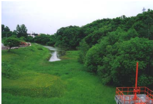
工業団地内の世田豊平川～工栄町