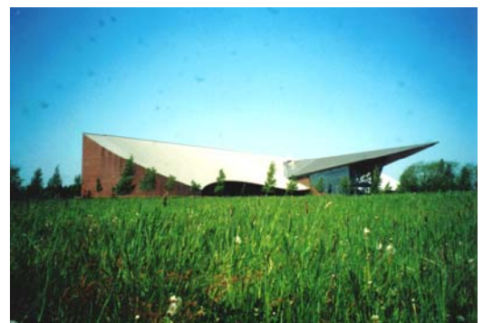
RTN地区内の企業～西野幌