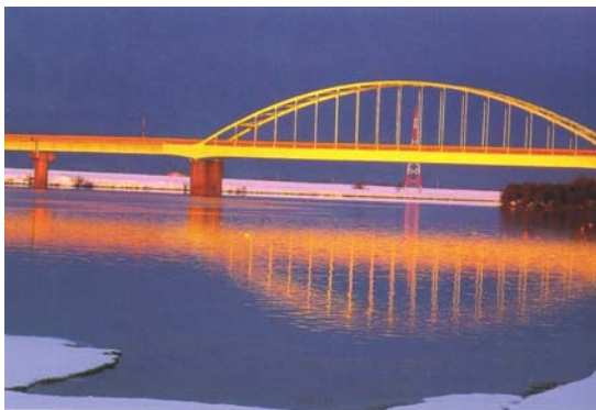
「朝陽に映える」 絵になる江別フォトコンテスト受賞作品