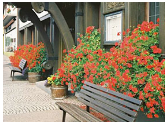
花による歓迎表現例