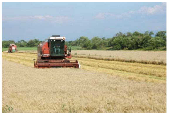
農村景観～収穫風景