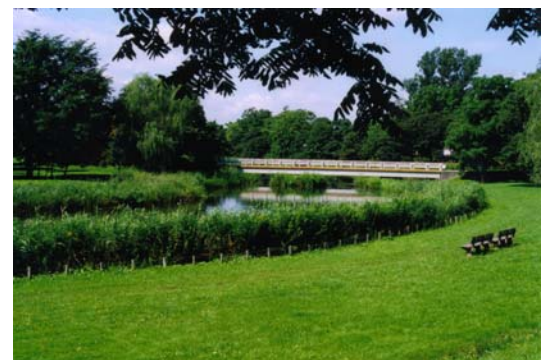
街なかの林と水辺～泉の沼公園