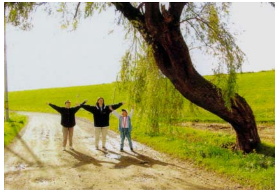
「私達3世代で守ります。祖母70母40孫6才」 絵になる江別フォトコンテスト受賞作品