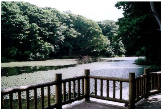
大麻中央公園の水辺