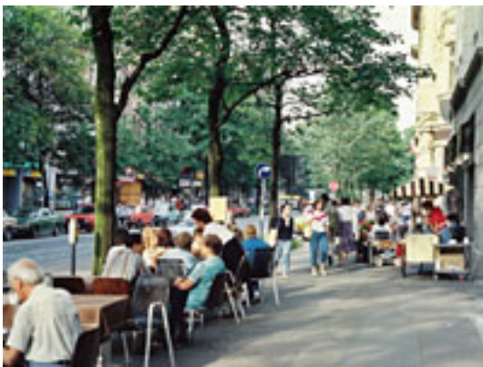
カフェテラスのある街並み例