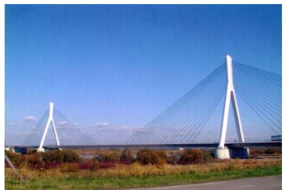
石狩川に架かる美原大橋