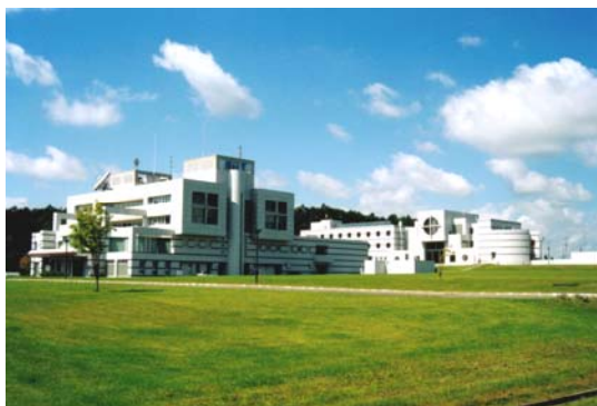
RTN地区内の民間施設～西野幌