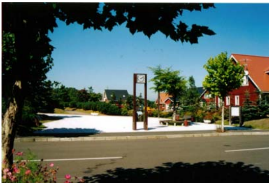
スウェーデンヒルズの住宅地～当別町