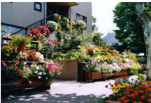
花いっぱいの庭づくり