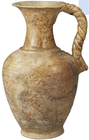
灰釉縄手付瓶 【重要有形民俗文化財】 平安時代(11世紀中期)