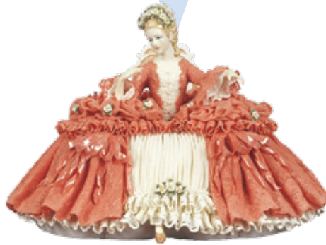
青地上絵金彩陽刻鷹図耳付花瓶(一对) 六代川本半助・瀧川惣助 明治時代(19世紀後期)