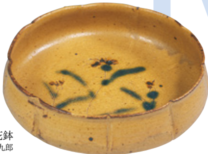
黄瀬戸輪花鉢 加藤唐九郎 昭和35年(1960)