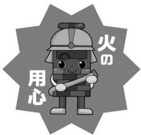
消防公式キャラクター「ポーカくん」

火の用心 年末は火災が多発する時季です。火の取り扱いには十分に注意しましょう。 ● 出火原因の上位は「たばこ」や「こんろ」です。吸い殻は確実に消し、寝たばこは絶対にやめましょう。また、こんろなど火を取り扱う時は必ず消火し、周囲に燃えやすいものを置かないでください。