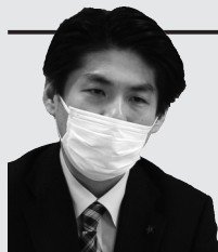
北海道中央バス㈱ 江別営業所