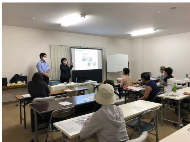
■ 7月10日 企業説明会の様子