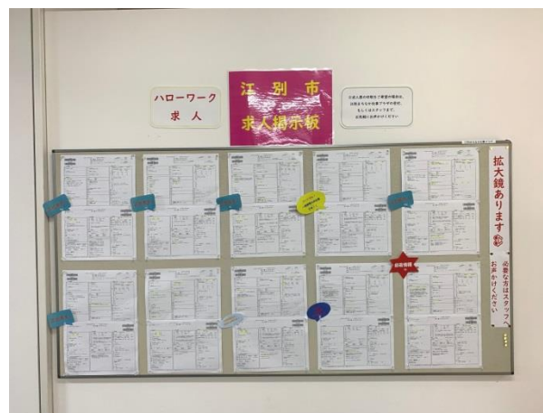
■ 江別市求人掲示板