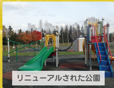
リニューアルされた公園