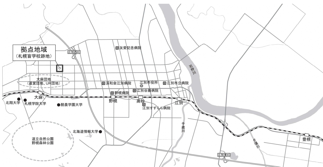
【図3】本計画の対象区域

4つの大学のうち、酪農学園大学、北翔大学、札幌学院大学の3校が大麻地区に、北海道情報大学が野幌地区に立地しています。