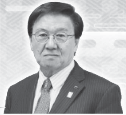
江別市長 三好 昇

現在、市議会では、交渉会 派の人数見直しや予算決算常 任委員会を設置したほか、議 会基本条例に基づき、議会運 営の見直しを進めております。 今後、市民の皆さまのご 意見やご要望に耳を傾け、情 報の共有を進め、より市民に 開かれた江別市議会を目指し てまいります。 結びに、新しい年が市民の 皆さまにとって、希望に満ち た、幸多き年となりますこと をご祈念申し上げます。