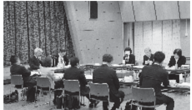
第5回委員会の様子 (12月11日 / 市民会館小ホール)

委員会の開催予定及び結果については、市立病院ホームページ ( http://www.ebetsu-hospital.jp/ ) にてお知らせします。