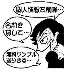
「消費者庁イラスト集より」