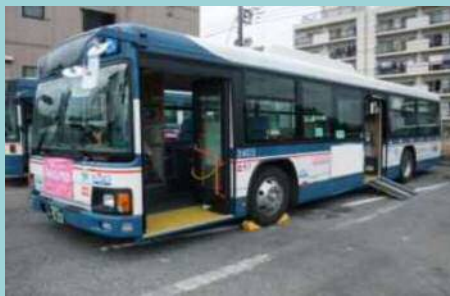
ノンステップバス

補助率：1／4又は補助対象経費と通常車両価格の差額の1／2のいずれか低い方(上限140万円)