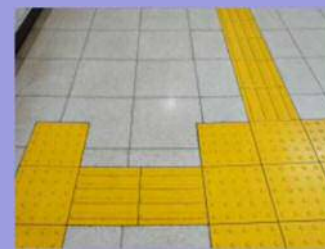
視覚障害者誘導用ブロック