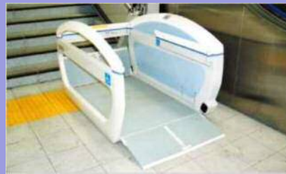
車椅子用階段昇降機