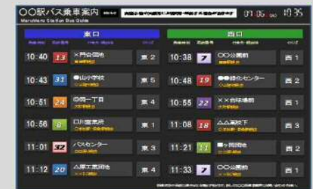
発車案内表示システム