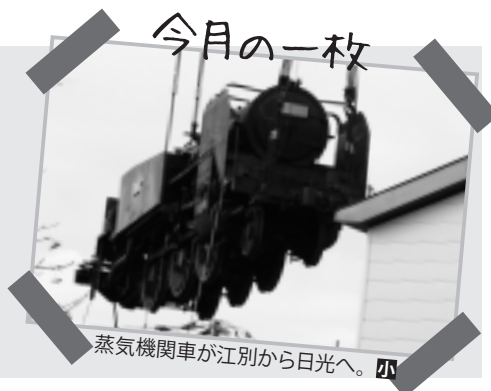
蒸気機関車が江別から日光へ。四

▶野幌駅前のNOPPOROイルミネーションの試験点灯を見学しました。とても寒い日でしたが、駅前広場に灯る光はとてもきれいで、温かく感じました。子どもの頃、家族で小さなクリスマスツリーの飾り付けをしたことを、ふと思い出しました。あの頃はよかった。四