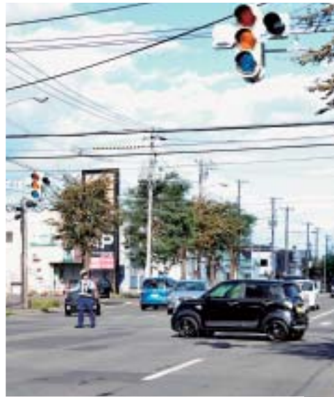
停電により信号機が消え、交通誘導が行われました