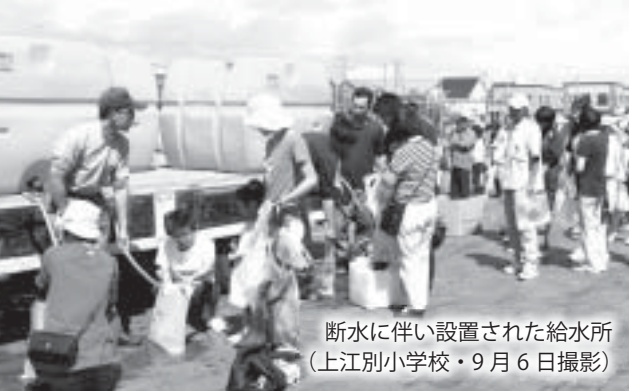
断水に伴い設置された給水所 (上江別小学校・9月6日撮影)

市内では、この大規模停電により、水を各家庭に送る配水ポンプなどが停止し、上江別浄水場の配水区域で断水が発生したほか、高層住宅などでは水をくみ上げるポンプが作動せず、給水が停止。市内9か所に給水所を開設して対応しましたが、停電と合わせ、日常生活に大きな影響を及ぼしました。 4日から5日にかけて市内を通過し、倒木や電柱の倒壊など大きな爪痕を残した台風21号に続く大災害。市では、日常生活を一刻も早く取り戻せるよう、被害箇所の復旧作業を進めていきます。