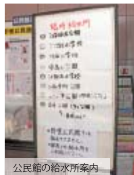
公民館の給水所案内