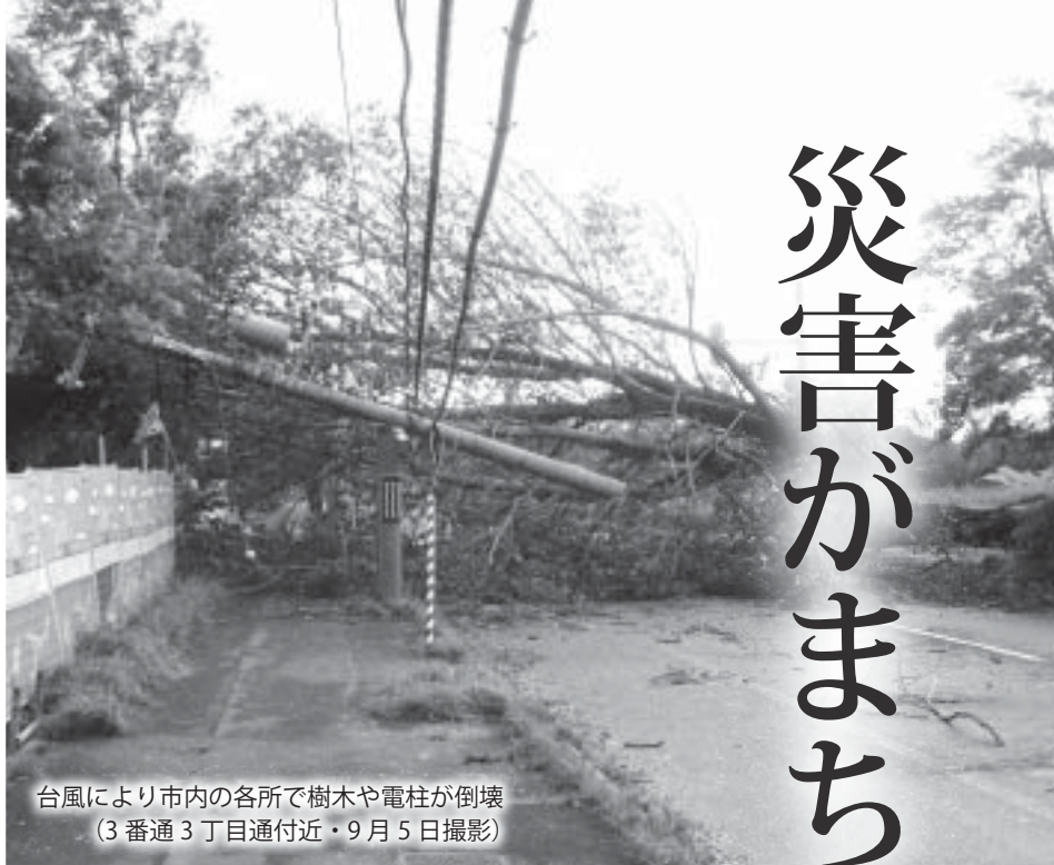
台風により市内の各所で樹木や電柱が倒壊 (3番通3丁目通付近・9月5日撮影)