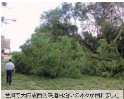
台風で大麻駅西側鉄道沿いの木々が倒れました

人口と世帯 (前月比) 118,961 人 (-57) 57,112 世帯 (-6) 平成30年9月1日現在