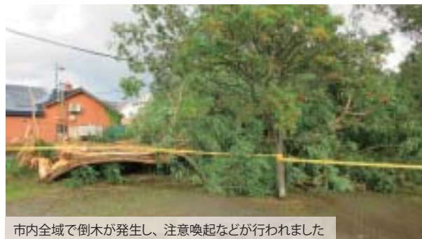
市内全域で倒木が発生し、注意喚起などが行われました