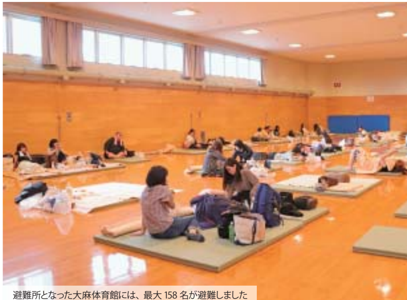
避難所となった大麻体育館には、最大158名が避難しました