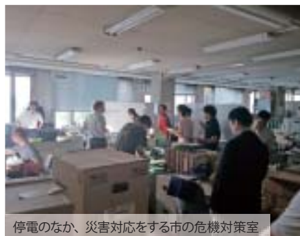
停電のなか、災害対応をする市の危機対策室