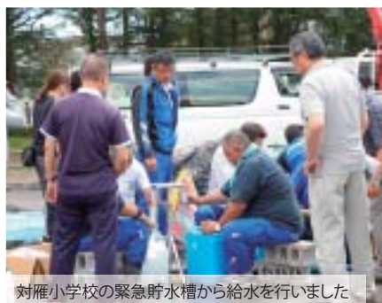
対雁小学校の緊急貯水槽から給水を行いました