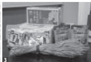
1. 製麺機のカット技術を説明する杉野社長(右) 2. 豊富な商品が棚に並べられています。3. えべちゅんら〜めんの麺は、菊水が持つ最高の技術で作られています。