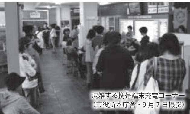
混雑する携帯端末充電コーナー (市役所本庁舎・9月7日撮影)