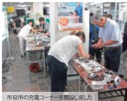
市役所の充電コーナーを開設しました