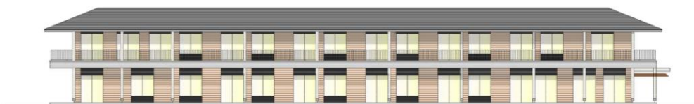
サービス付き高齢者向け住宅(イメージ)