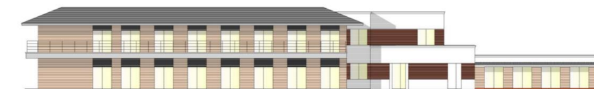
介護老人保健施設