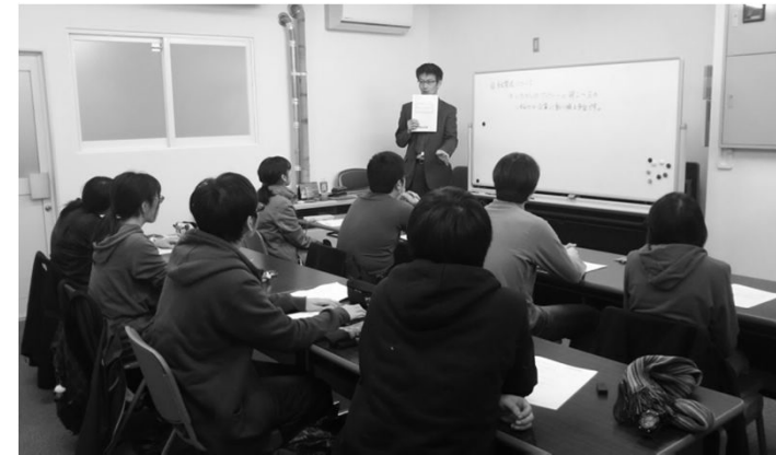
拠点施設での研修の様子