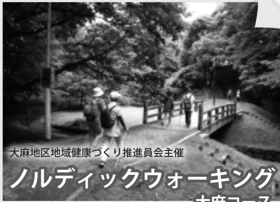
大麻地区地域健康づくり推進委員会主催