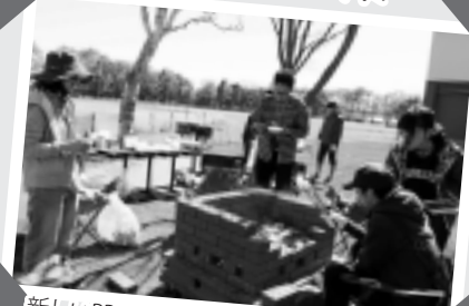
新しいBBQスポット「えみくる」発見! ☒