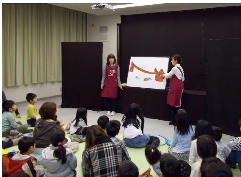
「おはなし会スペシャル」の様子（平成25年4月27日）

そのためには、学校や情報図書館、児童センター等における読書活動の実態を踏まえて、読書活動の推進に向けた場所や機会を提供することによって、望ましい読書環境づくりに努めることが重要です。