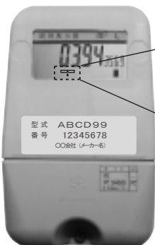
（電子式メータ表示器の一例）