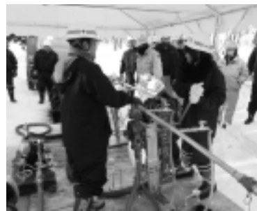
訓練による災害対応技術の継承

の災害への備えも課題となっており、経営環境は厳しさを増しています。現行のビジョンの計画期間が今年度で終了するため、現在、これらを踏まえた次期ビジョンの策定を進めています。