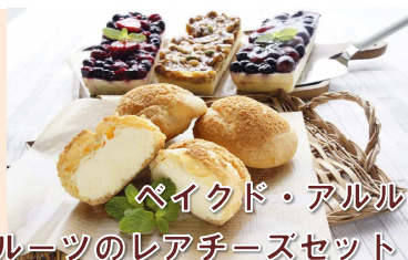
ペイクド・アルル