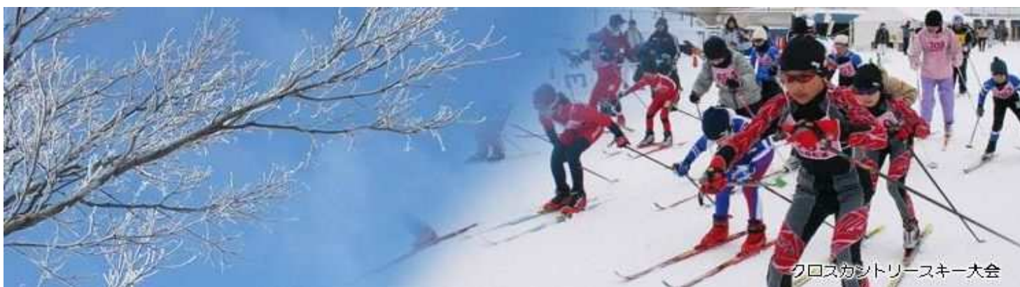
クロスカン트리スキー大会