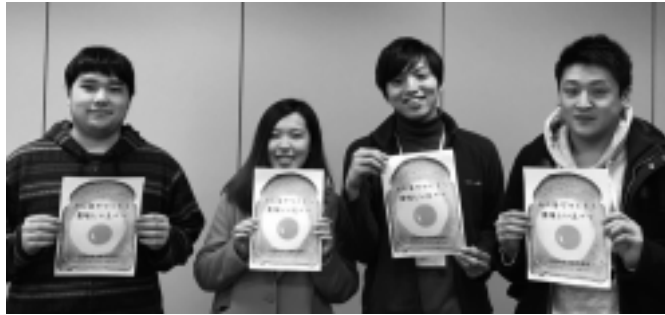
啓発リーフレットをデザインした北海道情報大学の学生たち