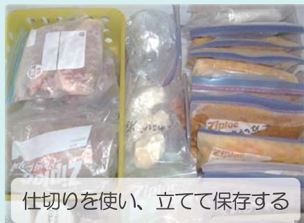
仕切りを使い、立てて保存する