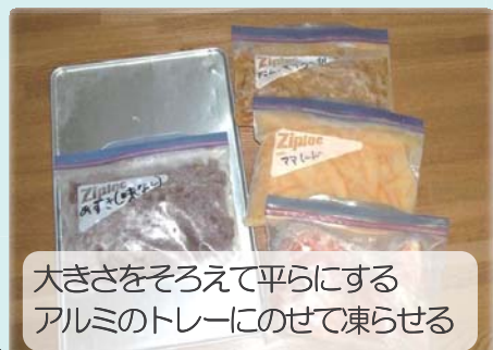
大きさをそろえて平らにするアルミのトレーにのせて凍らせる