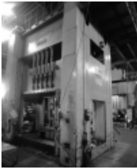
巨大な油圧式プレス機。車両用信号機カバーを製造している。

企業データ 匠プレス工業株式会社 所在地/工栄町25番地3 ☎ 383-2188 従業員数/26人 設立/昭和53年 創業/昭和31年