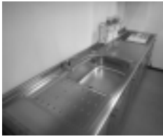
精密な金型により作られるステンレスキッチン

道内で唯一、厨房用品を製造しているのが、匠プレス工業株式会社です。 同社は昭和38年にステンレス流し台の量産体制を確立。現在、ステンレスキッチンや灯油タンクなどを製造しています。なかでもステンレスキッチンは年間1万3千台を販売しています。 同社を支えているのは、高度な金属プレス加工の技術です。「絞り」という技術を用い、1枚の金属板をプレス機で変形加工することで、継ぎ目のない均一な厚みの「くぼみ」を加工することができま