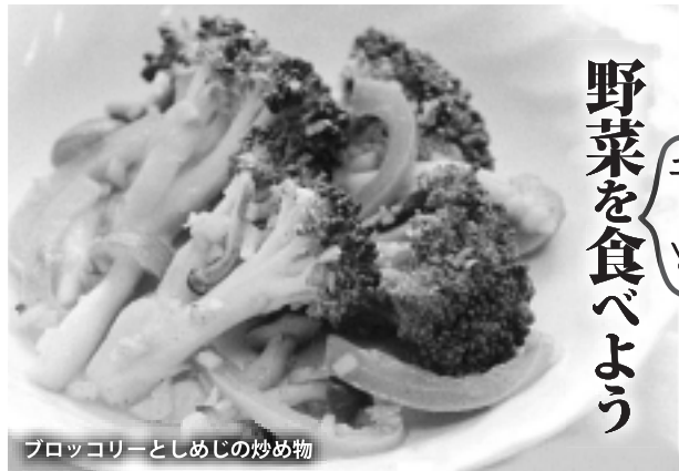
ブロッコリーとしめじの炒め物

ビタミンはだんだん減少します。冷蔵庫で保存し、早めに使い切りましょう。スープなどビタミンが溶け出した汁ごと食べる料理もおすすめ