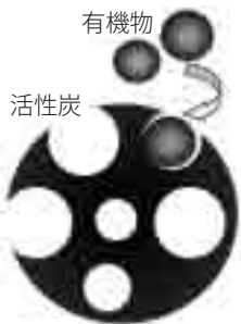
活性炭への有機物の吸着イメージ