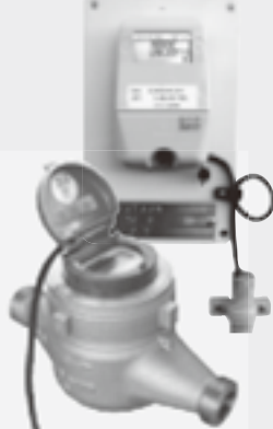
地下に設置する本体

水道メータは8年ごとに取り替えを行っています。平成27年度からはその際、電子式メータを設置しています。