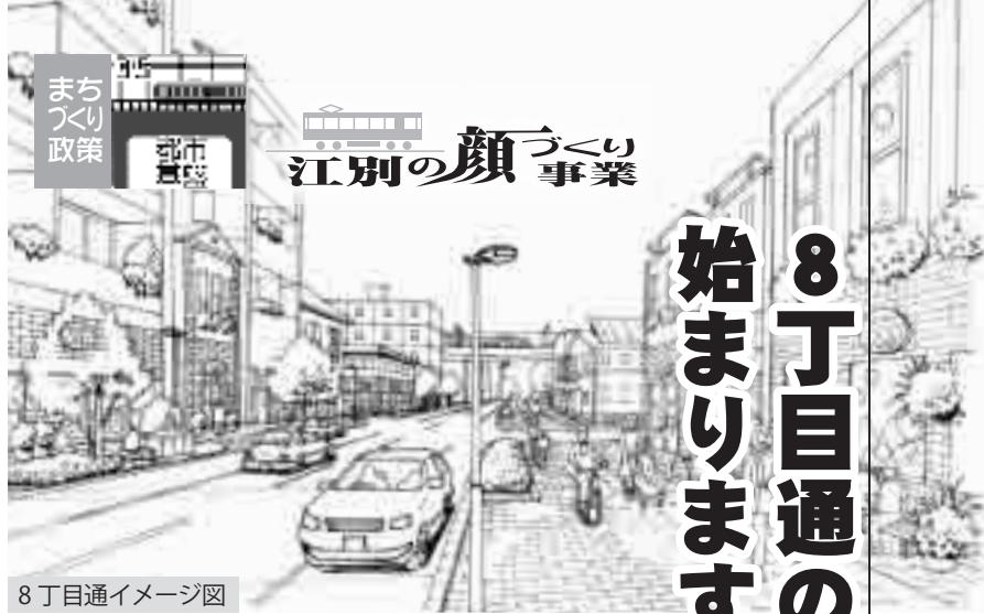
8丁目通イメージ図