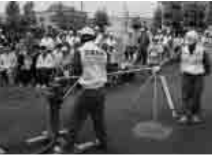
若草公園で行われた説明会

通常時の貯水槽は配水管と接続され新鮮な水が流れていますが、地震などの災害によつて配水管の圧力が低下すると、貯水槽と配水管をつなぐ遮断弁が自動的に作動して両者を分離し、非常用の水道水を確保します。