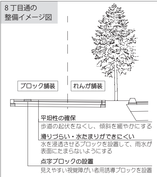
8丁目通の整備イメージ図

とご協力をお願いします。整備の詳しい内容は、札幌建設管理部当別出張所（☎0133-23-2220）へ。 【詳細】都心整備課 ☎381-1082