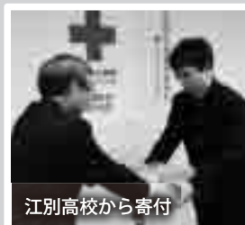
江別高校から寄付

義援金の受付は6月30日(休)まで。義援金は、日本赤十字社を通じて被災県に送られます。市としては熊本地震災害に100万円を寄付しています。窓口/市役所本庁舎福祉課 (15番窓口、☎381-1031) 郵便振替/口座番号:00130-4-265072、口座名義:日赤平成28年熊本地震災害義援金