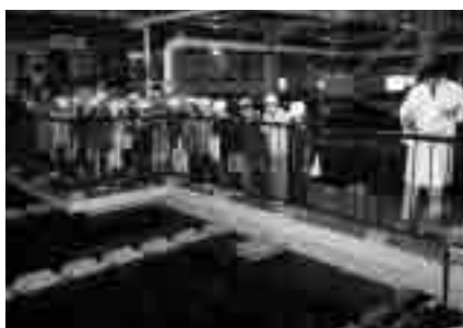
浄水過程を見学する小学生