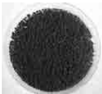
泥を加工した融雪剤