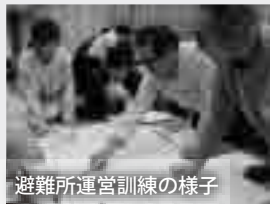
避難所運営訓練の様子