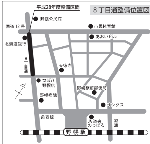
8丁目通の整備イメージ図