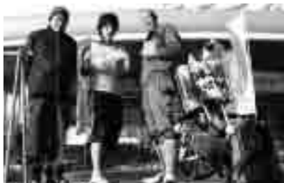
旅先での出会い(瀬戸内海を渡る「しまなみ海道」の途中、伯方島の道の駅で)