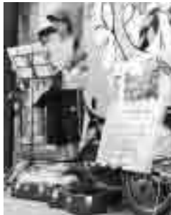
盛岡市での路上ライブ