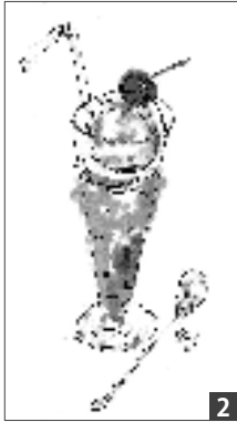
1 北翔大学生に指導する渋谷さん。2 渋谷さんが描いた作品。やわらかいタッチで、色鮮やか。 3 企画デザインした江別小麦めんのパッケージ

市内大学生が商業施設EBR I（3月25日全面オープン）壁面に描いたチョコレートアート。小麦の穂やチーズなど地場産品が散りばめられています。指導したのは市内在住のデザイナー渋谷真澄さん（57歳）。江別を詳しく知らない学生が江別の未来をどう表現するか、学生のアイデアと意見を尊重しながら作成しました。渋谷さんの本業は、企画デザインをする「クリエイティブ・ソーダ（平成19年設立）」の代表。ハルユタカの手提げ袋のデザインをはじめ、イベント企画まで行う地域密着型のデザイナーです。