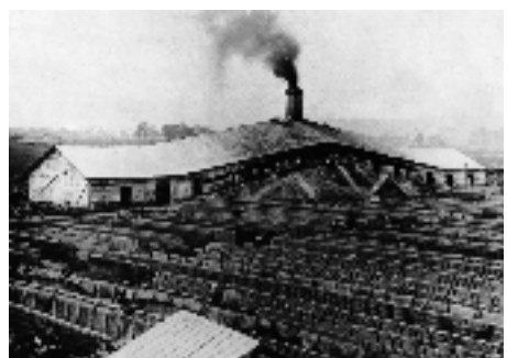
北海道炭礦鉄道(株)野幌煉化工場 両登り窯

北海道の重要な産業であった「石炭産業」。空知管内産炭地の歴史と北海道炭礦汽船(株)について、野幌煉化工場や夕張鉄道(株)などのことも含めてお話しします。