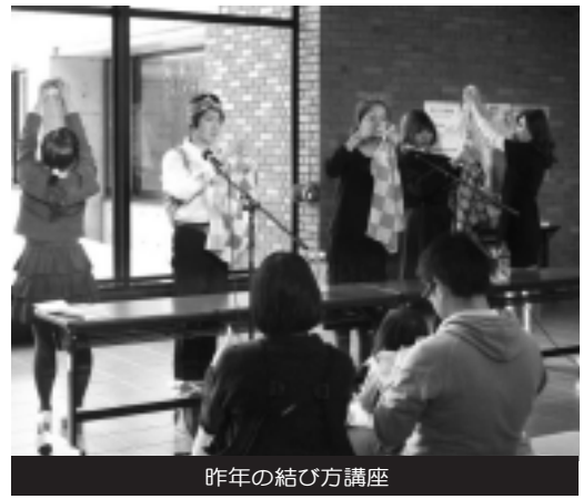
昨年の結び方講座