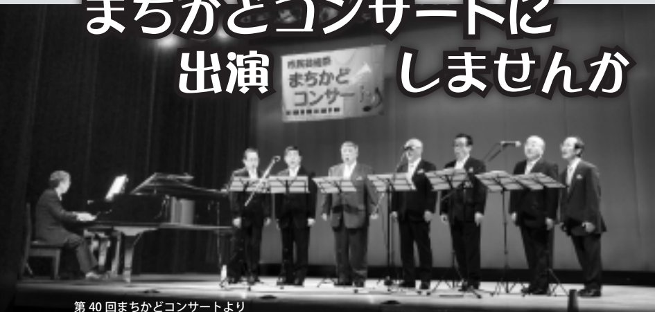
第40回まちかどコンサートより

まちかどコンサート実行委員会では、6月25日(土)「第41回まちかどコンサート(会場/コミュニティセンター)」と12月3日(土)「第42回まちかどコンサート(会場/えぼあホール)」の出演者を募集します。