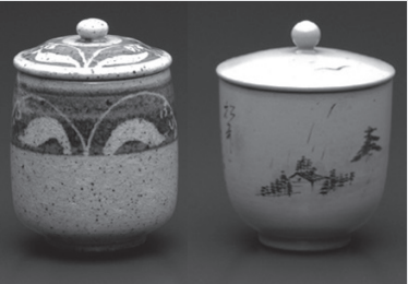
▶ 小さな湯呑に職人の技が光る 写真は、野幌(現東野幌町)にあった石狩陶園(石狩窯園)で制作された湯呑。

ちよっと昔のやきもの日本縦断旅 明治後期から昭和初期にかけて全国各地から収集された湯呑のコレクション約280点を展示。 日本の庶民層がもつともやきものに親しみ、楽しんだ時代に作られた地方色豊かな湯呑の数々を紹介。 日時 / 6月21日(土)～8月10日(日)9時30分～17時(最終入場16時30分)。 会場 / セラミックアートセンター1階北のやきもの展示室。 観覧料 / 一般450円(360円)、高校生・大学生350円(280円)、小学生・中学生100円(80円)、夫婦割80円、※( )内は20名以上の団体。身障者手帳受給者は無料。※リピーター割引もあり。(一般300円、高校生・大学生300円、小学生・中学生80円、夫婦600円) ※北のやきもの展示室は準備のため6月13日(金)～20日(金)は閉室。 【詳細】 セラミックアートセンター ☎ 385-1004