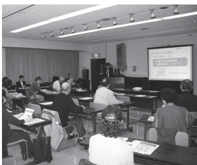
▶平成25年住宅耐震化セミナーの様子