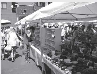
▶たくさんの露店が軒を連ねる