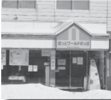
▶ 現地相談窓口のほっとワールドのっぽ