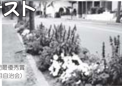
昨年の街路A部門最優秀賞 (大麻沢町 16丁目自治会)

江別市民憲章推進協議会では、「花のある街並みづくり」コンテストの参加作品の募集を行っています。入賞作品は、写真を市内三公民館で一定期間パネル展示します。