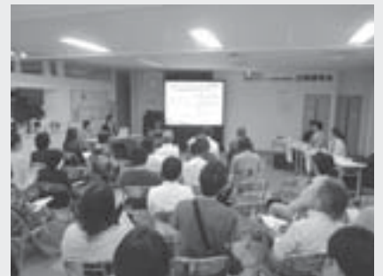
▲6月に公開選考会を実施し、選定された団体は、事業の中間報告書の提出(11月予定)と、来年2月(予定)の報告会への参加が必要です。