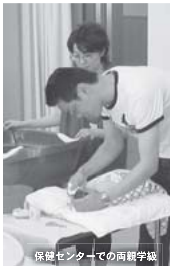
保健センターでの両親学級